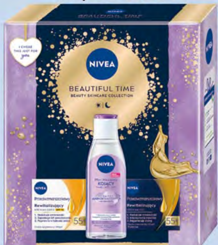
NIVEA XMAS BEAUTIFUL TIME