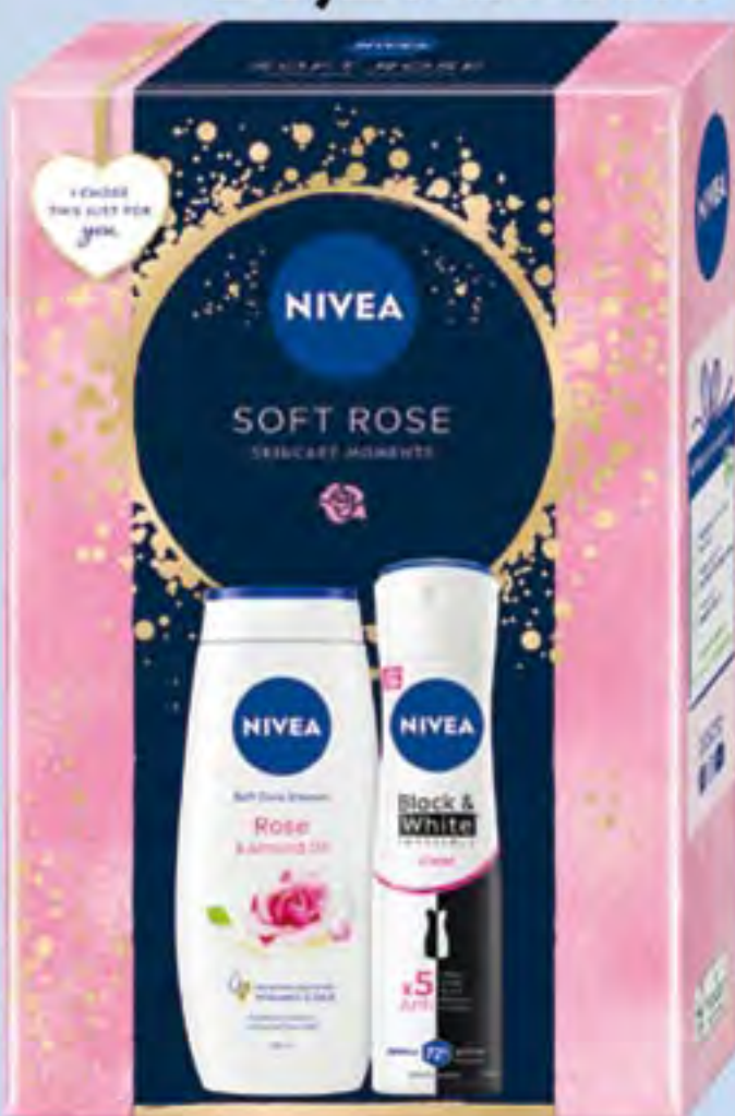
NIVEA XMAS SOFT ROSE