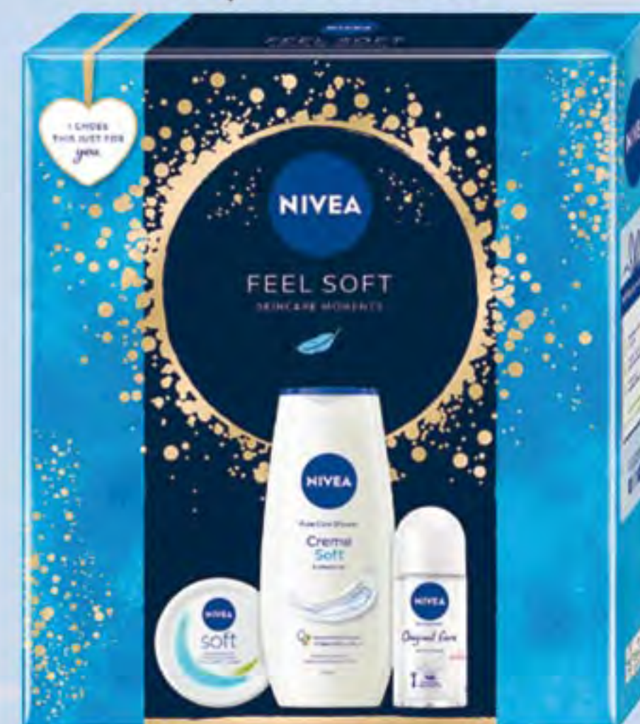
NIVEA XMAS FEEL SOFT