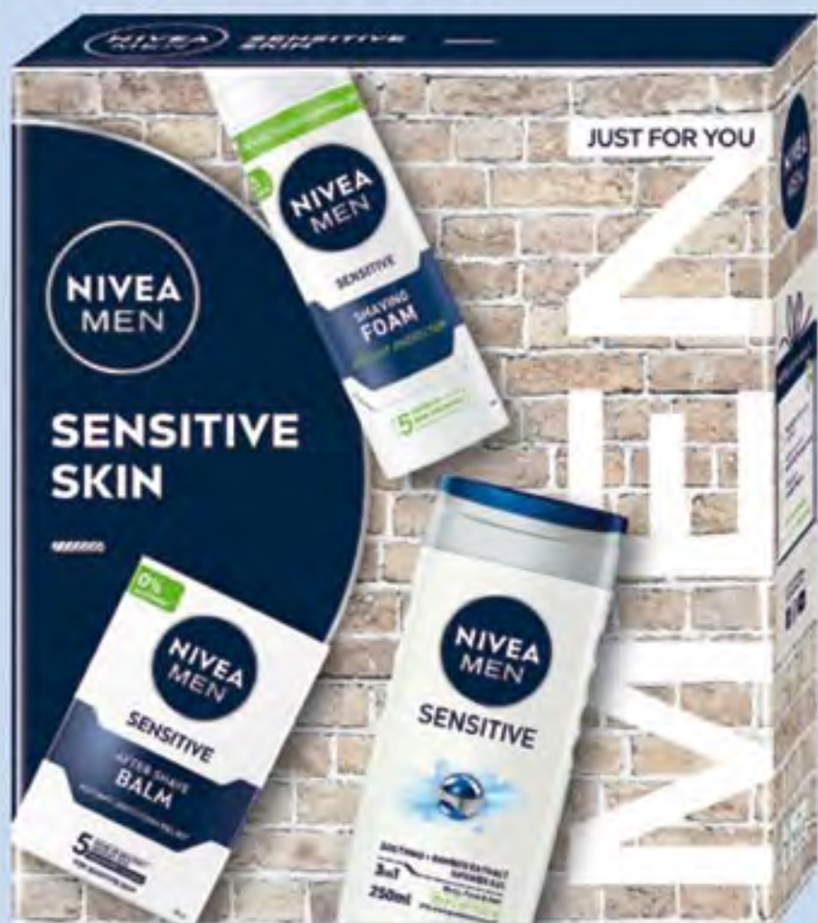
NIVEA MEN XMAS SENSITIVE SKIN