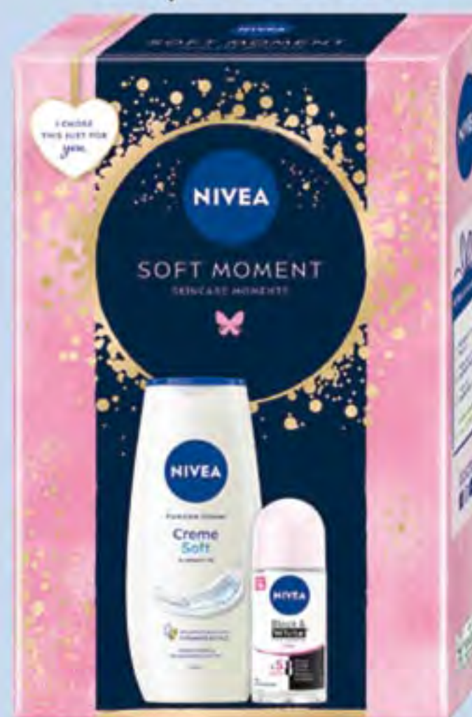
NIVEA XMAS SOFT MOMENT