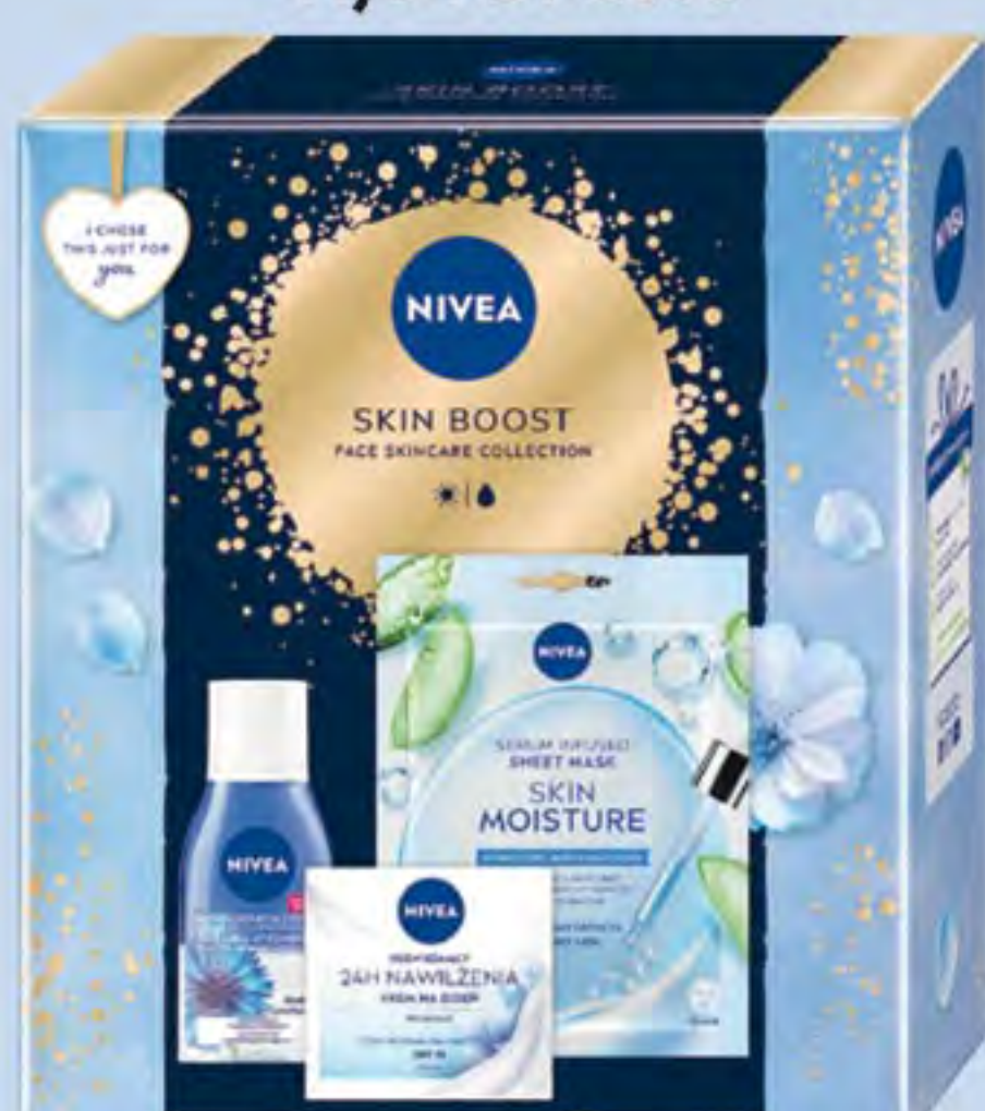
NIVEA XMAS SKIN BOOST