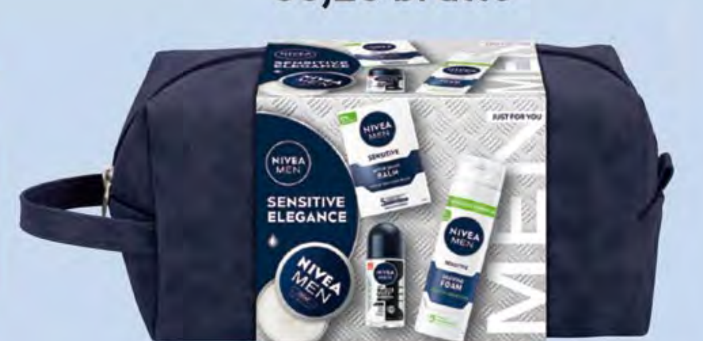
NIVEA MEN XMAS SENSITIVE ELEGANCE