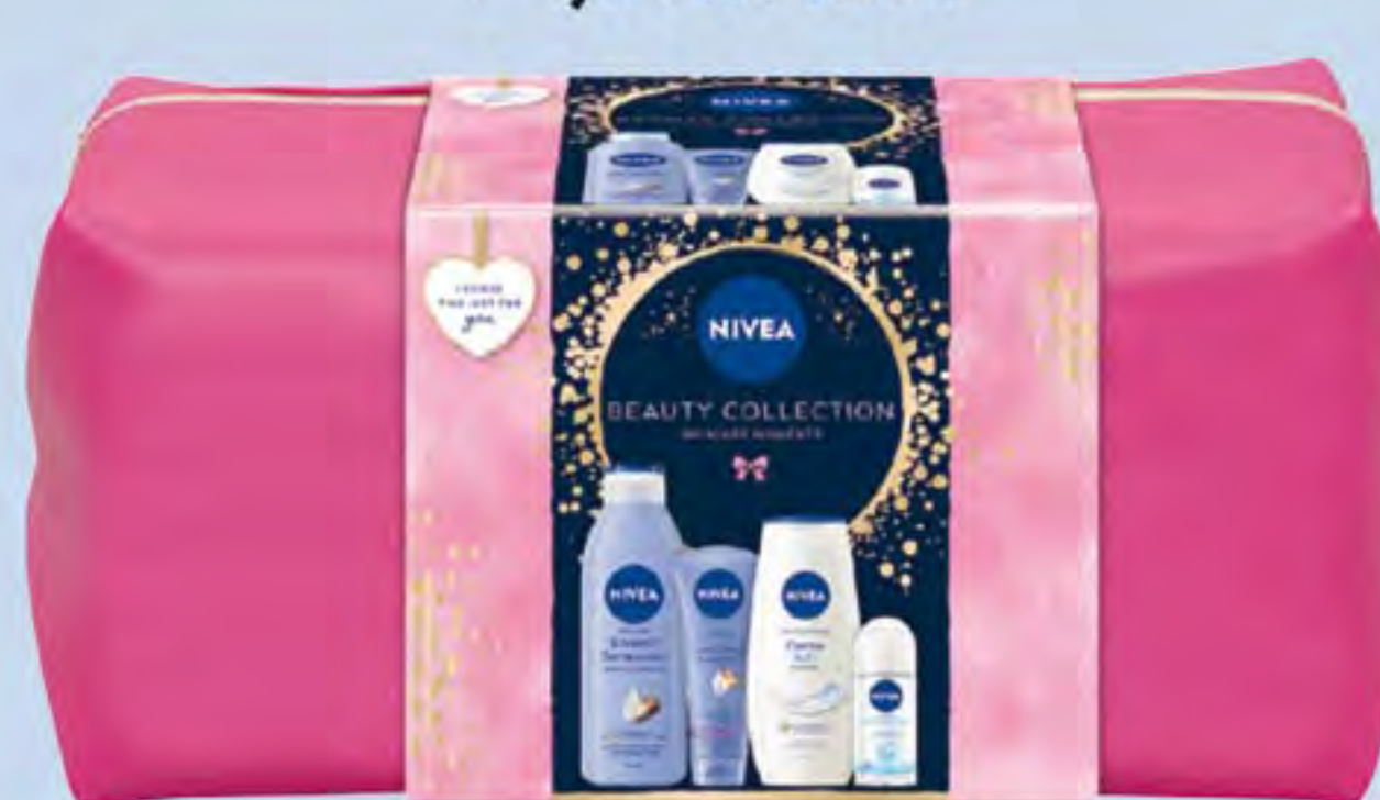
NIVEA XMAS BEAUTY COLLECTION