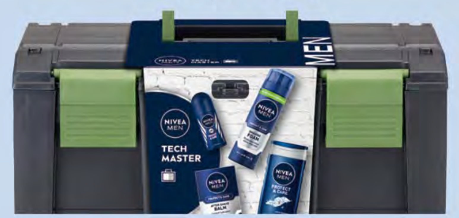
NIVEA MEN XMAS TECH MASTER