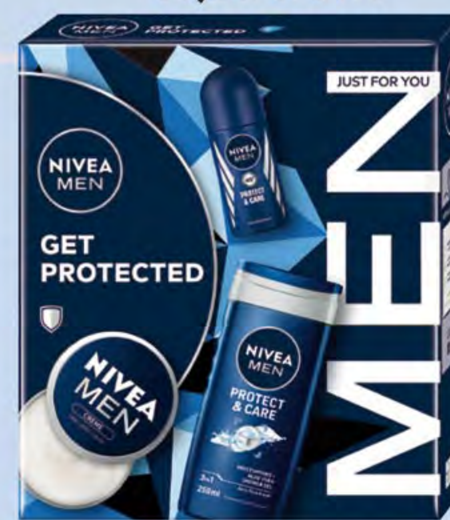
NIVEA MEN XMAS GET PROTECTED