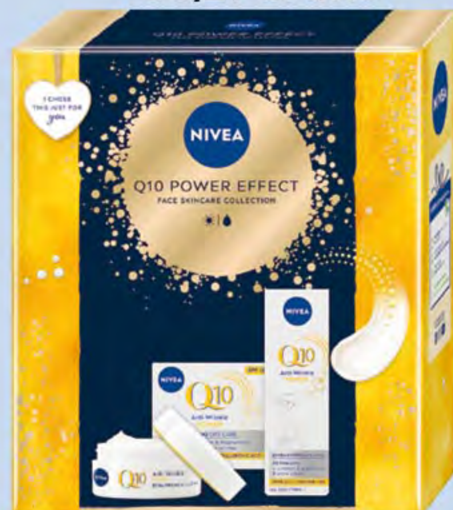
NIVEA XMAS Q10 POWER EFFECT