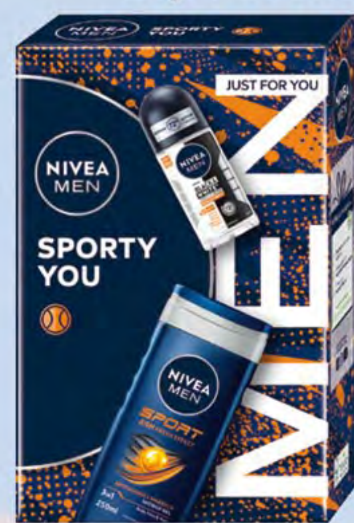
NIVEA MEN XMAS SPORTY YOU