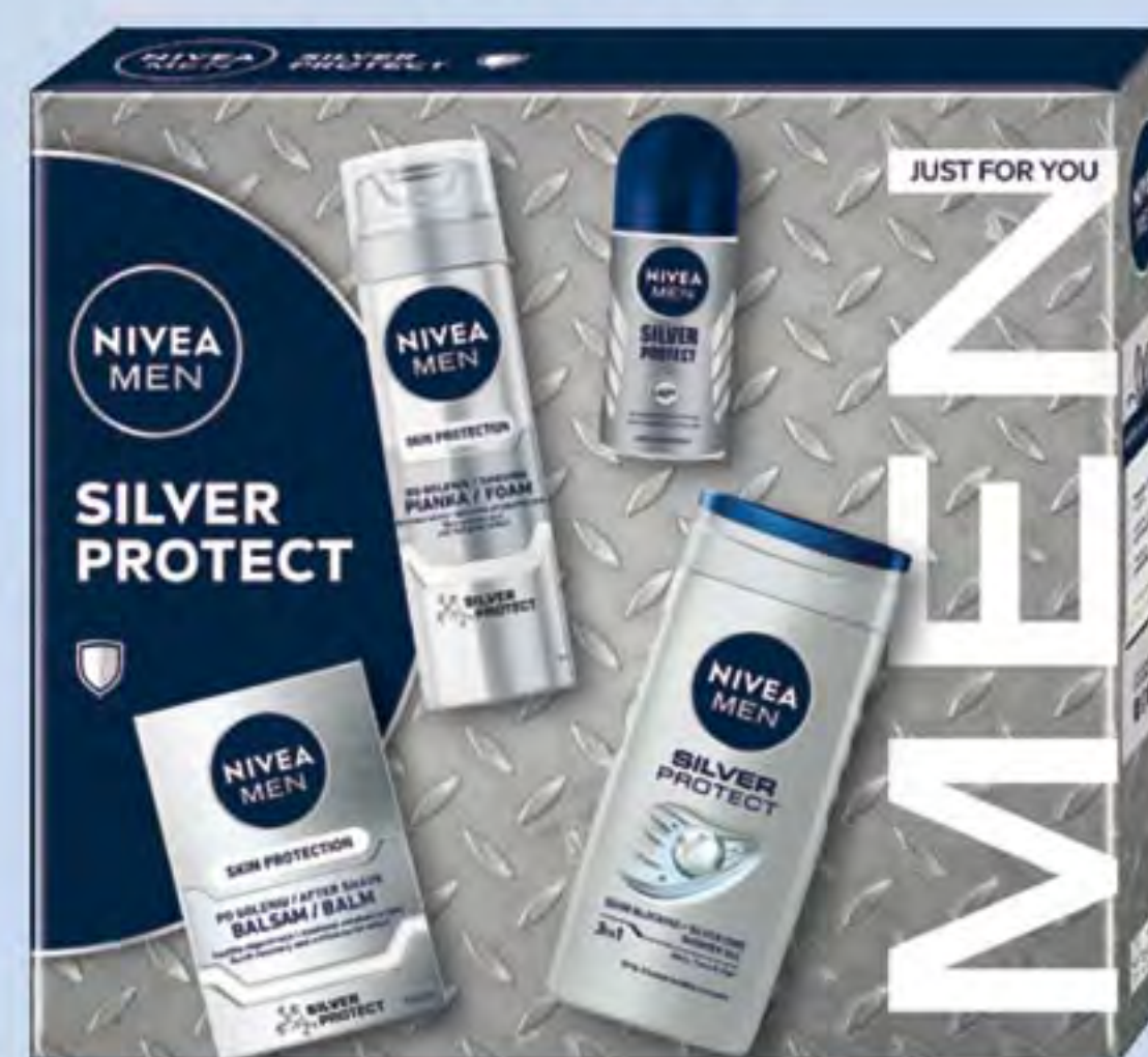
NIVEA MEN XMAS SILVER PROTECT COLLECTION