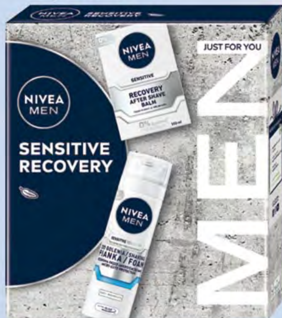
NIVEA MEN XMAS SENSITIVE RECOVERY