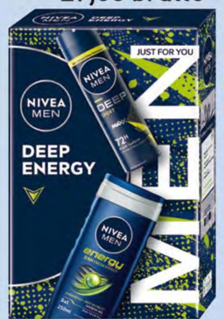
NIVEA MEN XMAS DEEP ENERGY