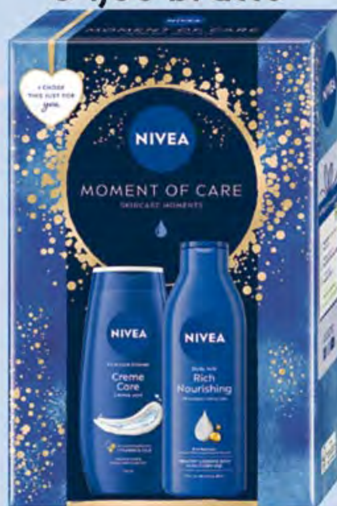
NIVEA XMAS MOMENT OF CARE