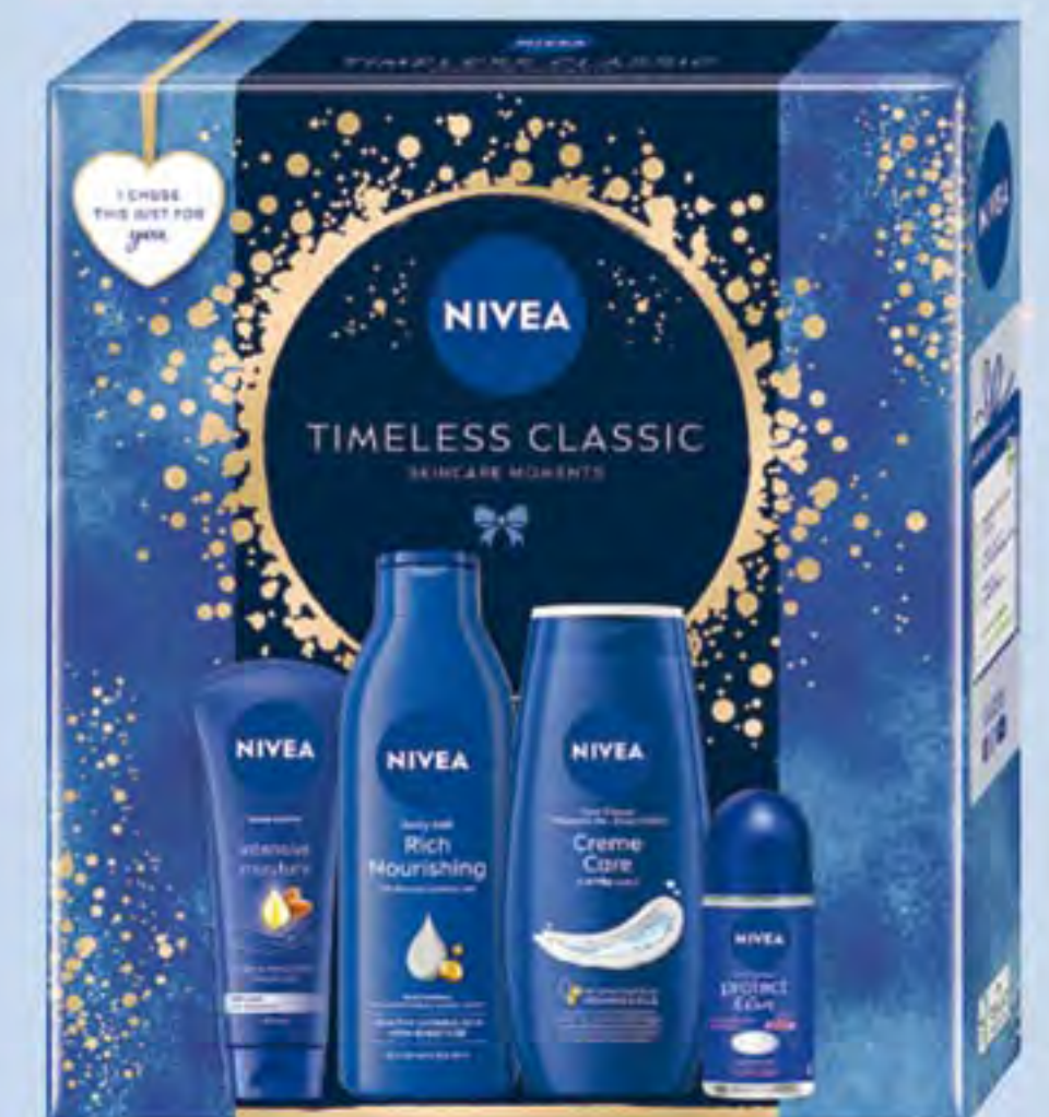
NIVEA XMAS TIMELESS CLASSIC